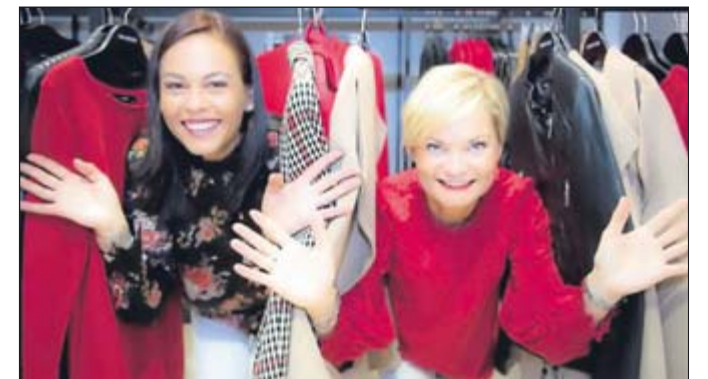
Shoppingspaß im Center verspricht der verkaufsoffene Sonntag.

An beiden Sonntagen sind die Geschäfte und Gastronomie des Centers jeweils von 13 bis 18 Uhr geöffnet.